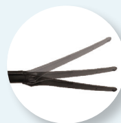
Angolo pantoscopico regolabile in 6 posizioni