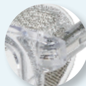
Dobradiças metálicas incorporadas.