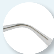
Hastes com alma metálica.