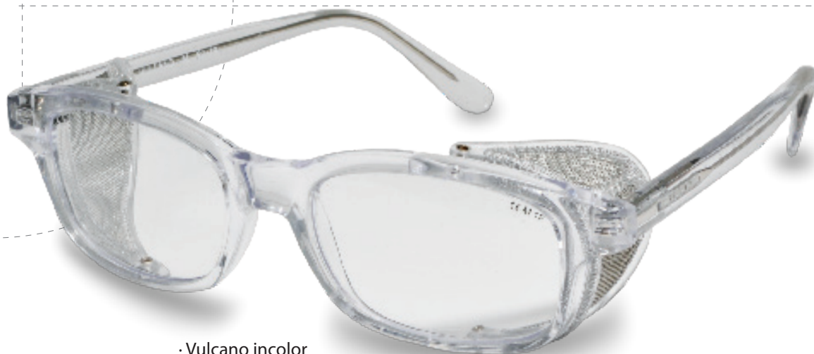
· Vulcano incolor