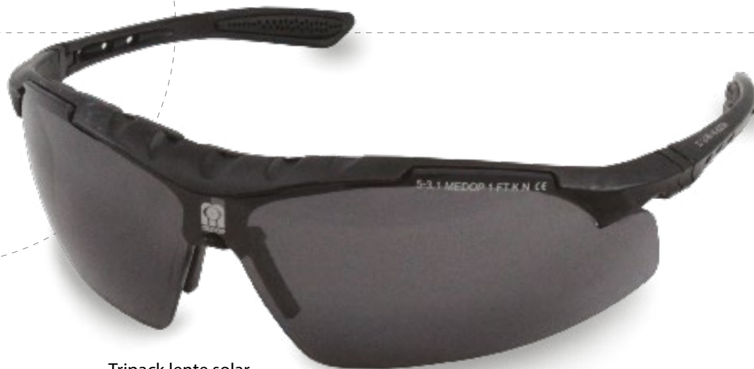
· Tripack lente solar