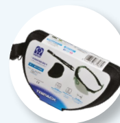
Apresentação em estojo.