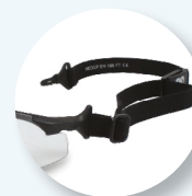
Stanghette intercambiabili con elastico