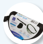
Presentazione in custodia