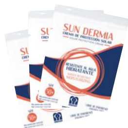
· Monodose 3 ml