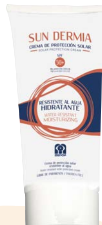
· Tubo 100 ml