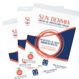
· Unidose 3 ml