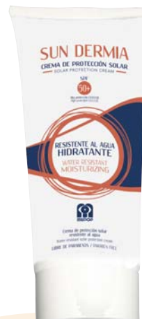
· Tube 100 ml