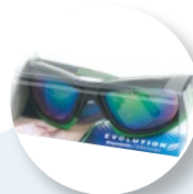
Presentazione in blister