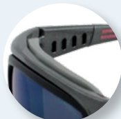
Schiuma interna antiurto