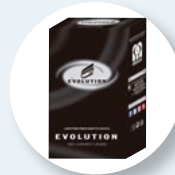
Presentazione della scatola delle lenti