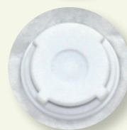
Valvola di esalazione