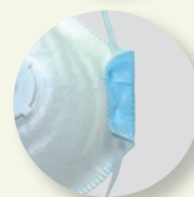
Fita dupla de ajuste.