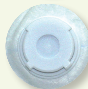
Válvula de exalação.