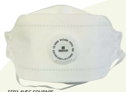
FFP3 AVEC SOUPE