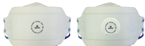
FFP2 SANS SOUPE