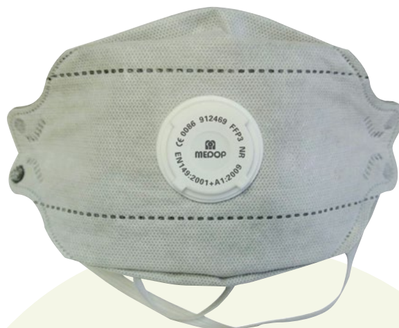
FFP3 AVEC SOUPE ET CHARBON ACTIF