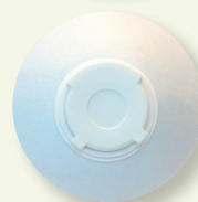
Valvola di esalazione