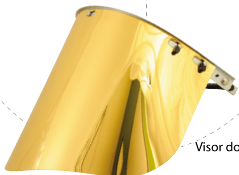
Visor dourado espelhado.