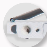
Visor regulável em altura.