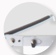
Ajuste ao capacete.