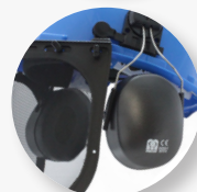
Adaptador compatível com auriculares para capacete (Ref. 907516)