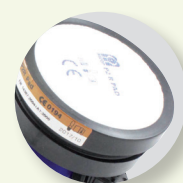
Filtro con raccordo filettato