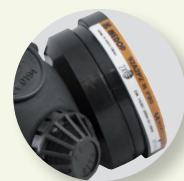
Filtro con raccordo filettato

Design migliorato con un maggior volume interno, offrendo una comodità superiore durante la respirazione. Maggior comfort respiratorio grazie ai suoi due filtri e alla sua valvola di esalazione. Questo modello permette l'uso combinato con altri dispositivi di protezione. I filtri si agganciano mediante raccordo filettato, fornendo una maggiore durata e una minore resistenza alla respirazione.