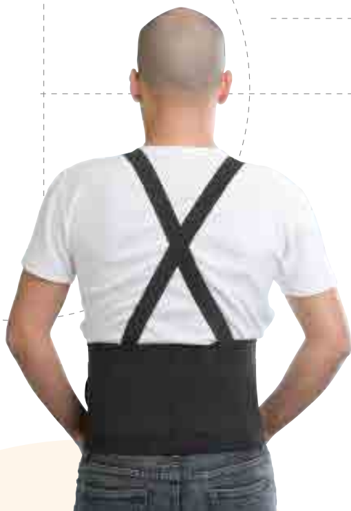
· Ceinture lombaire à bretelles