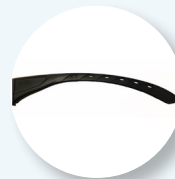
Stanghette piatte e sottili