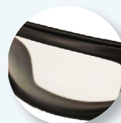
Schiuma interna che fornisce comfort e adattabilità