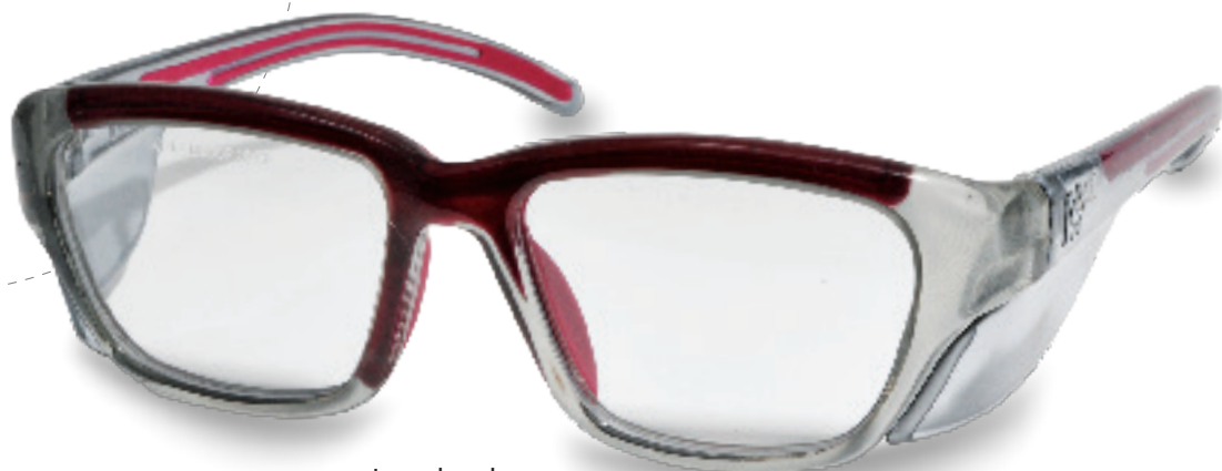
· Jerez bordeaux