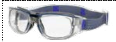
INCOLORE / BLEU