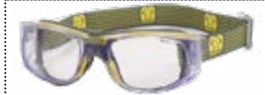
INCOLORE / JAUNE

*Traitement des verres correcteurs appliqué aux deux côtés du verre :