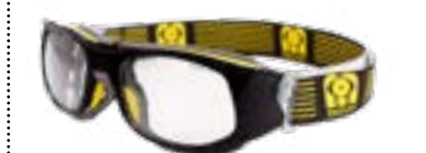
NOIR / JAUNE