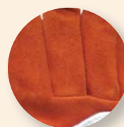
Palmo in crosta di pelle: antitaglio livello 2