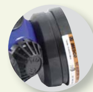
Filtro a rosca.