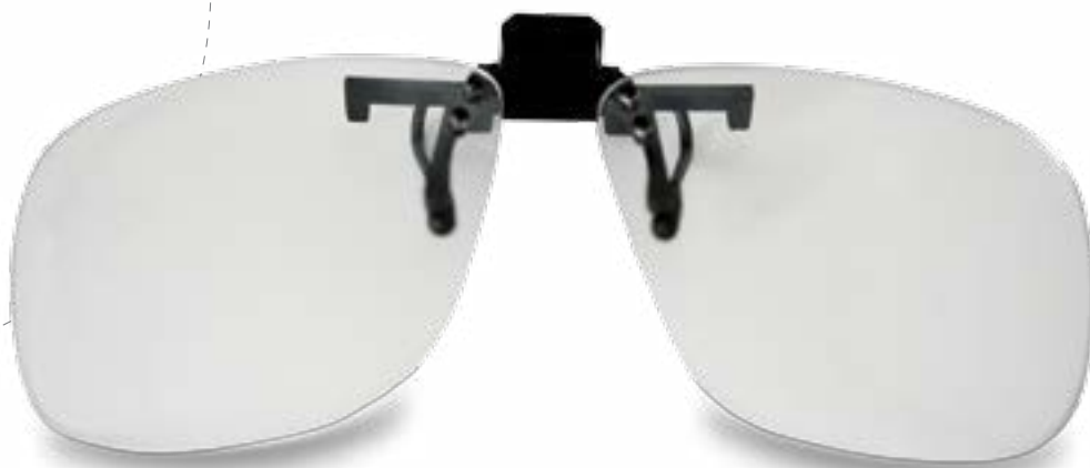
· Clip incolor