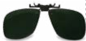
· Clip soldadura