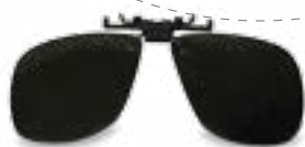
· Clip solar polarizado