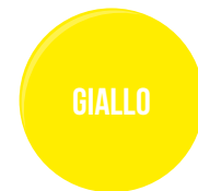
PER AMBIENTI CON SCARSA LUMINOSITÀ O PER GUIDA NOTTURNA