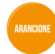
PER AMBIENTI SCURI O CHE RICHIEDONO UN'ELEVATA PRECISIONE