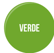
PER AMBIENTI NAUTICI E DI MONTAGNA