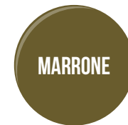
PER ESTERNI DURANTE GIORNATE ANNUVolate