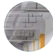
LUCE ARTIFICIALE (INTERNI)