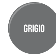
PER ESTERNI DURANTE GIORNATE ASSOLATE