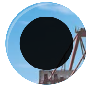
LUCE DEL SOLE (ESTERNI)

IN CONDIZIONI DI LUMINOSITÀ CANGIANTE: OSCURAMENTO AUTOMATICO