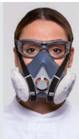
XTREME HYBRID Neutri con tratt. antiappannante (N) e graduati con tratt. Antifog

Per l'uso combinato con la Semimaschera MedopAir II, Medop raccomanda degli occhiali con trattamento antiappannante, evidenziando i seguenti modelli per le loro prestazioni: