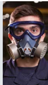
KIBO Con tratt. antiappannante (N).