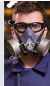
KAMBA Con tratt. antiappannante (N).